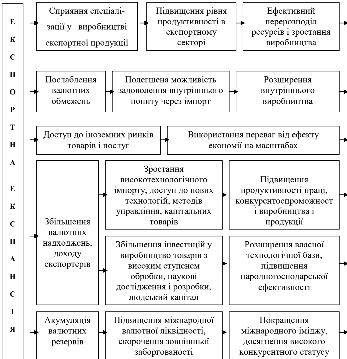
Рис. 1. Взаємозв'язок між експортною експансією та економічним зростанням країни

Характерною особливістю сучасного стану розвитку експортної діяльності регіонів України є глибокі зміни у співвідношенні динаміки можливостей загальнодержавного і регіонального рівнів експортної діяльності і відповідно посилення експортної активності регіонів. Отже, формування якісно нового рівня взаємовідносин України із світовим співтовариством потребує глибокого вивчення об'єктивних основ та обґрунтування практичних шляхів розгортання більш активної участі її регіонів в експортній діяльності, розширення їх повноважень в організації і розвитку цього процесу.