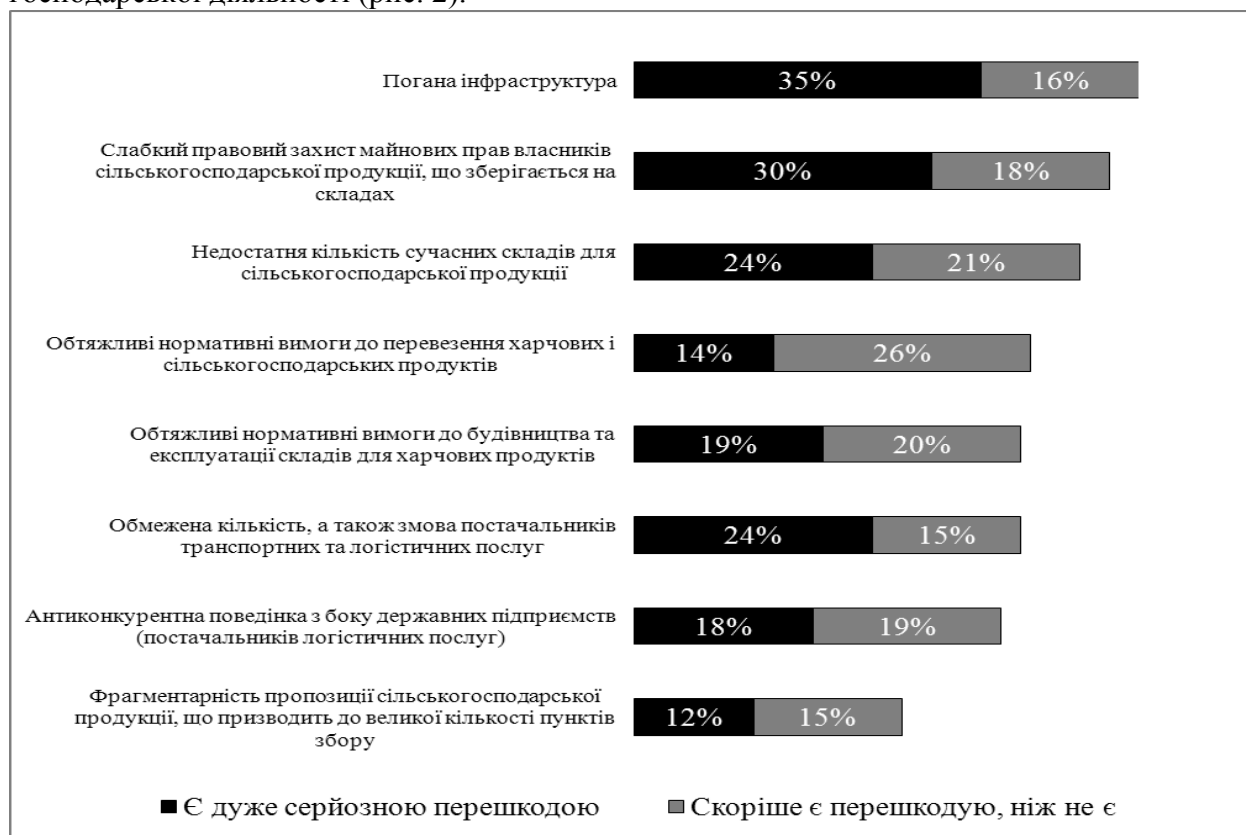
Рис. 2. Основні перешкоди для ефективного маркетингу та логістики в сільському господарстві [7, с. 77]

Підтверджують це і дослідження проведені іноземними фахівцями IFC «Інвестиційний клімат в Україні», який діє в нашій державі вже протягом 14 років. Він сприяє сталому економічному зростанню країн, що розвиваються, фінансуючи інвестиції, надаючи компаніям та урядам консультативні послуги, мобілізуючи приватний капітал на міжнародних фінансових ринках. Основному увагу в своїх дослідженнях вони приділили агропродовольчій сфері. Зазначивши, що низька якість послуг із післязбирального транспортування й логістики обумовлюється поганим станом транспортних засобів і складських приміщень, низьким рівнем захисту прав власності фермерів на сільгосппродукцію, що зберігається на зовнішніх елеваторах, незадовільним станом системи складських свідоцтв. Згідно з дослідженням IFC, існуюча нормативна база, що регулює надання послуг із післязбирального транспортування й логістики сільськогосподарської продукції, є ще однією вагомою перешкодою для розвитку галузі. Це підтвердили майже 80% опитаних підприємств, близько 45% сільгосппідприємств вказали на відсутність складських приміщень як на ще одну перешкоду для здійснення господарської діяльності (рис. 2).