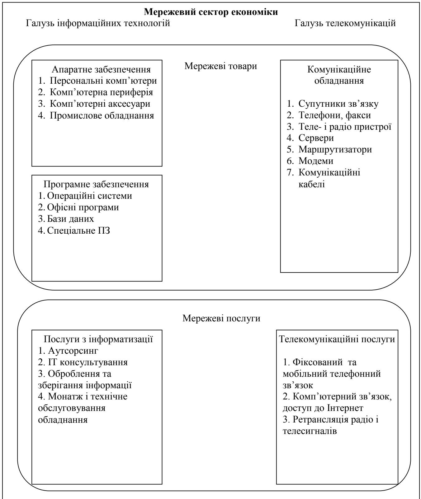
Рис. 1. Структура мережевого сектору економіки

товарами та послугами, що заснована на активному використанні ІКТ та мережі Інтернет (рис. 1). По-друге, мережева економіка являє собою якісно нову інституціональну систему економічної організації (суспільно-виробничих відносин), що засновується на горизонтальних взаємозв'язках, їх добровільності, вільному доступі до інформації та засобів комунікації.