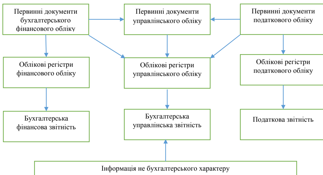
Рис. 1 . Інтегрована інформаційна база, яка використовується під час формування інформації бухгалтерської управлінської звітності [12, с. 19]

– контроль за роботою менеджерів та робочими процесами підприємства з метою попередження та виявлення недоліків.