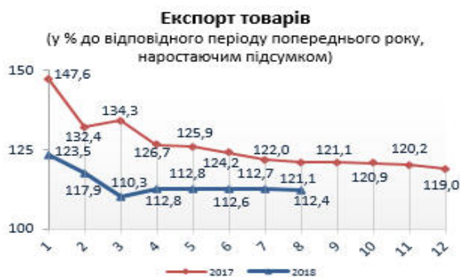
Рис. 1. Динаміка експорту товарів станом на 01.08.2018 р.

Джерело: складено за даними Державної служби статистики України