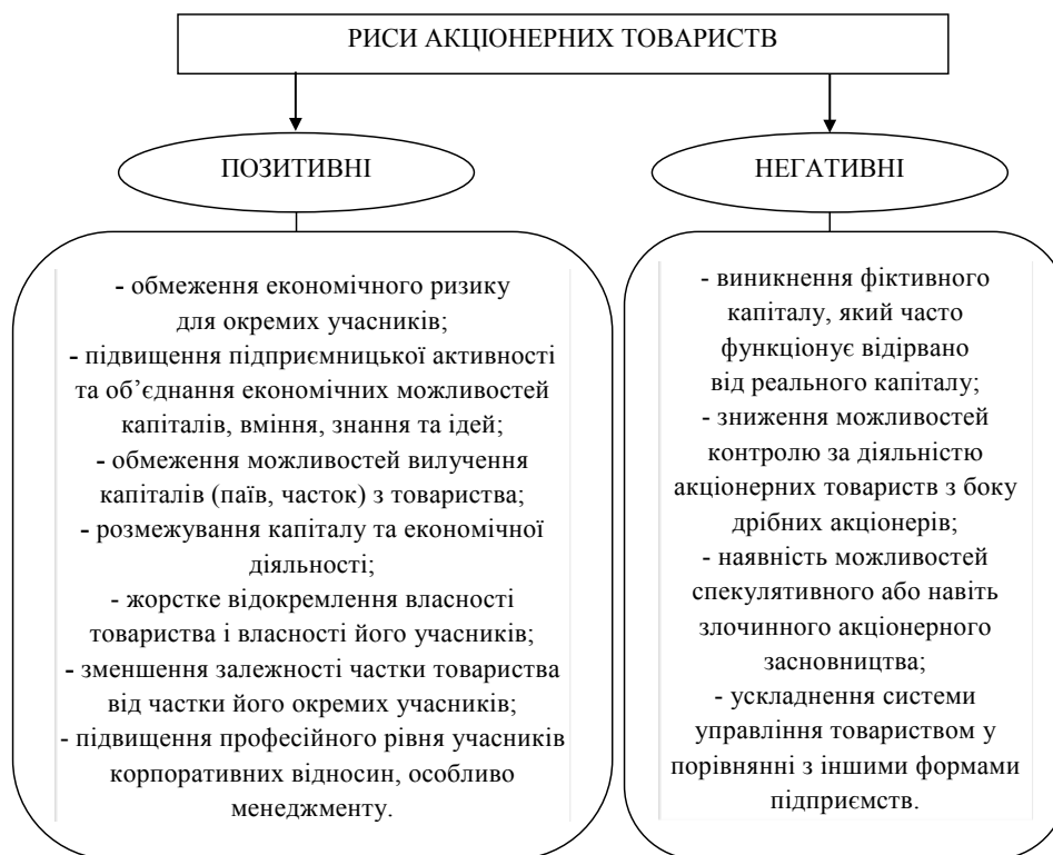
Рис. 3. Позитивні та негативні риси акціонерних товариств

дати належні їм акції за ринковою ціною. Тож особа, що претендує на контрольний пакет, повинна мати досить коштів, щоб придбати всі 100% акцій, якщо цього вимагатимуть міноритарії;