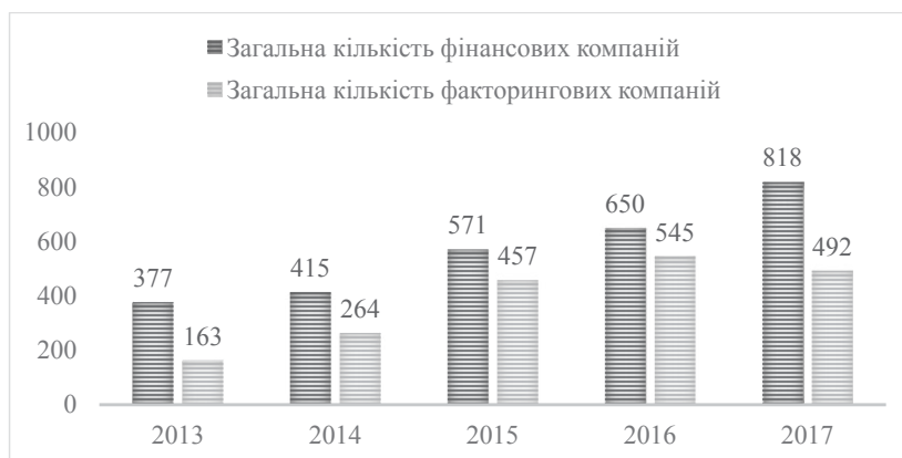
Рис. 1. Чисельність фінансових та факторингових компаній в Україні за 2013-2017 роки

Актуальним є питання відображення факторингових операцій в обліку. Задля уникнення викривлень у фінансовій та податковій звітності підприємств, постачальникам необхідно правильно обліковувати факторинг. В Україні не існує чітких методичних рекомендацій щодо обліку факторингових операцій.