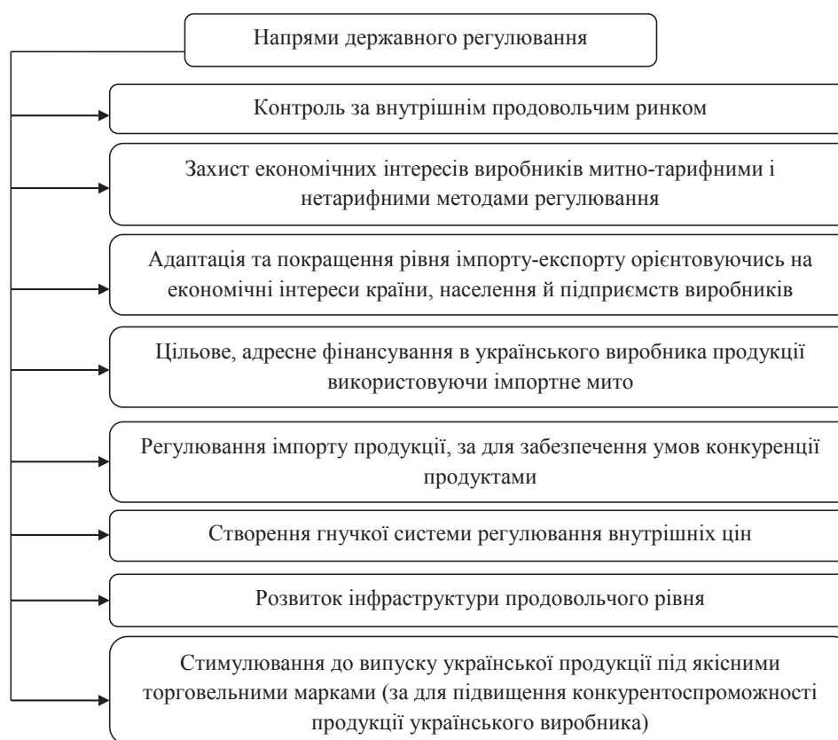
Рис. 3. Напрями державного регулювання

Примітка: згруповано автором на основі Постанови «Деякі питання продовольчої безпеки»