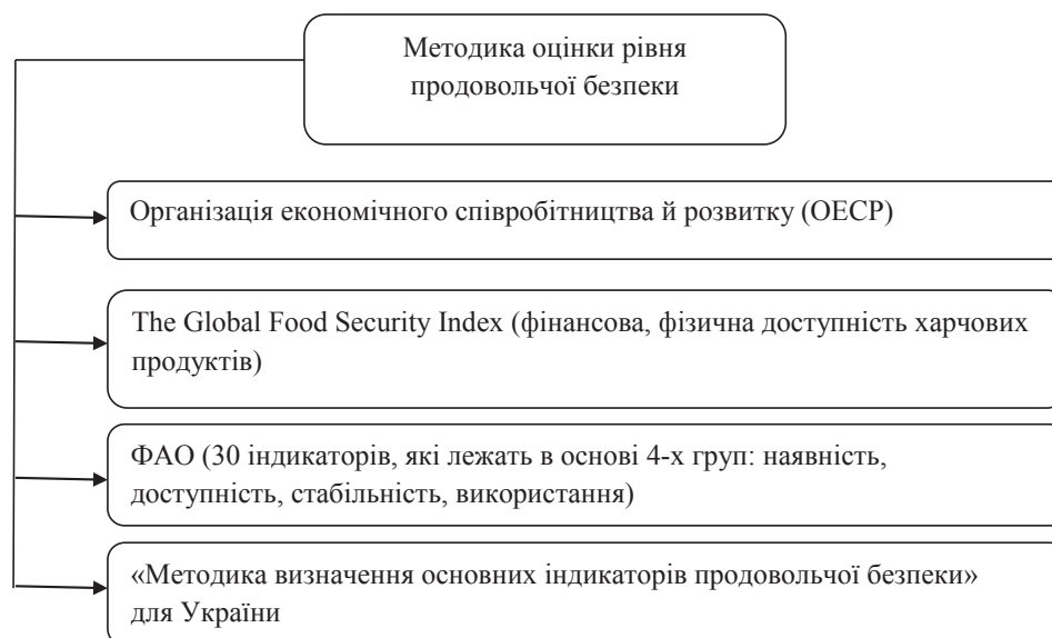
Рис. 1. Методика оцінки рівня продовольчої безпеки

Примітка: згруповано автором на основі Григорьев Є.О. [5]