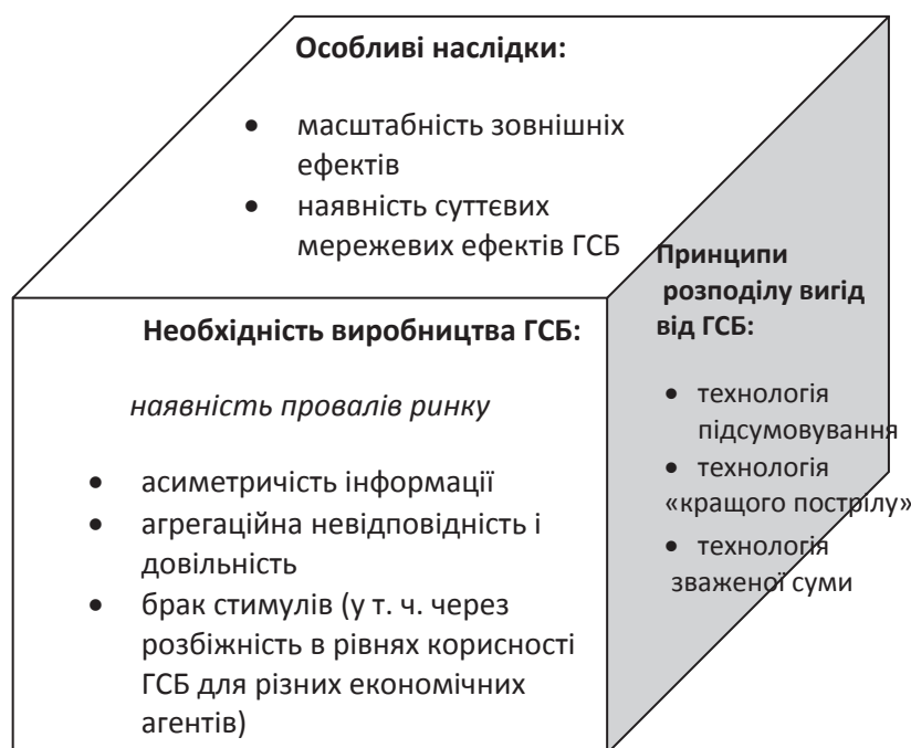
Рис. 1. Аргументація необхідності виробництва ГСБ

Зважаючи на те, що глобальним суспільним благам, що виробляються за рахунок ГЕВ, притаманні характеристики звичайних суспільних благ загалом та глобальних суспільних благ зокрема, визначальними