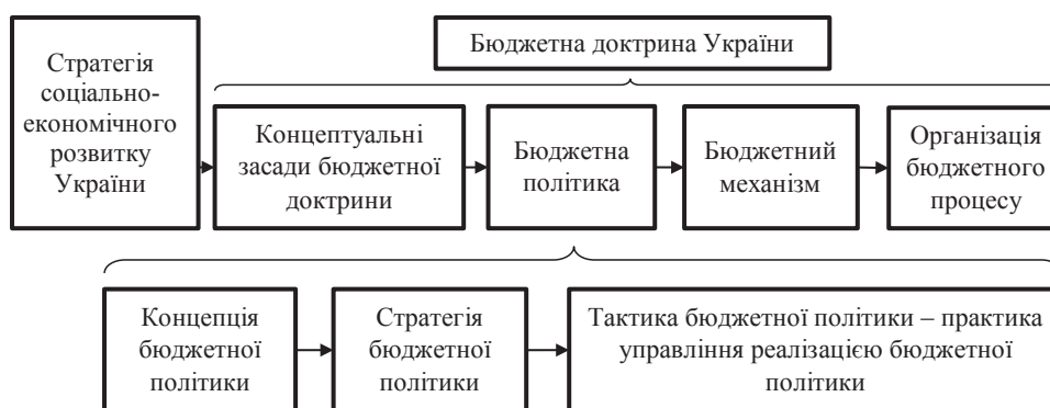
Рис. 1. Структура бюджетної політики України з позиції наукового підходу та її місце в системах вищого та нижчого ієрархічних рівнів управління

Іншим аспектом удосконалення бюджетної політики є синталітика зв'язку «концепція – стратегія – тактика». З цього приводу відзначимо, що «реалізація будь-якої політики зумовлює необхідність обґрунтування стратегічних і тактичних цілей, в іншому разі політика має ситуативний і як результат – суперечливий характер» [4, с. 69]. Відтак існування стратегії та тактики бюджетної політики є логічним та обґрунтованим. У контексті їх взаємодії з концепцією, наведемо думку Л.В. Лисяк, яка зазначає, що «стратегія бюджетної політики регулювання соціально-економічного розвитку виступає в єдності, тобто фактично є складовою, із соціально-економічною стратегією й тактикою, спрямованою на розвиток суспільства» [5, с. 130]. Як обґрунтовувалося вище, за умов відсутності якісної стратегії соціально-економічного розвитку України, її роль у контексті наукового забезпечення процесу формування та реалізації бюджетної політики буде покладено на концептуальне обґрунтування останньої.