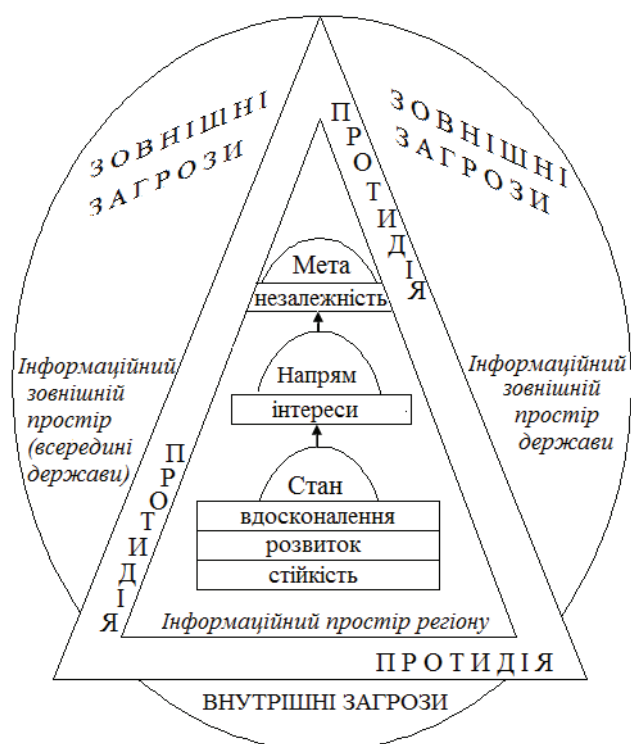
Рис. 1. Концепт-модель модулів економічної безпеки регіону в контексті інформаційного простору

На рис. 1 представлено концепт-модель модулів економічної безпеки регіону в контексті інформаційного простору.