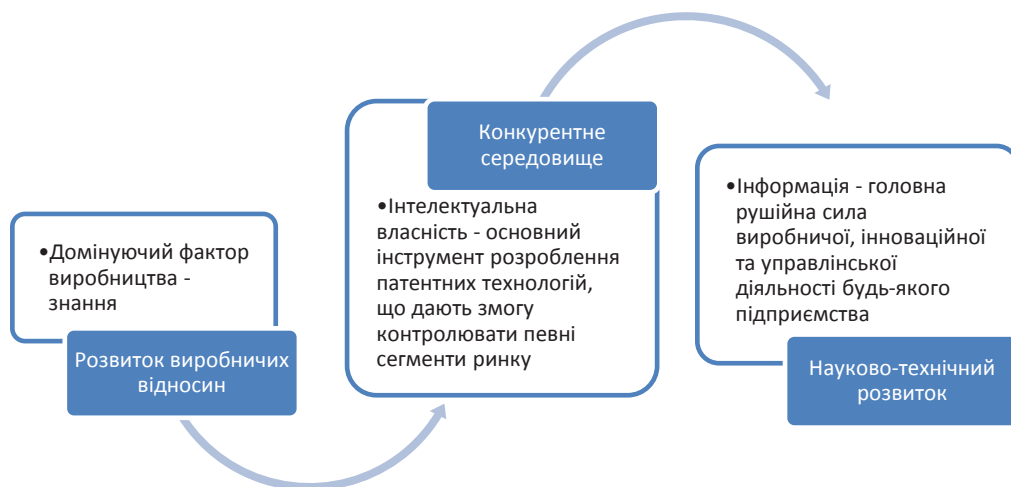
Рис. 2. Архітектоніка концепту інтелектуальної власності на постіндустріальному етапі розвитку суспільства

Через мінливе конкурентне ринкове середовище в системі управління економічною діяльністю підприємства найбільш складним і неоднозначним питанням є управління інтелектуальною власністю. Це обумовлено