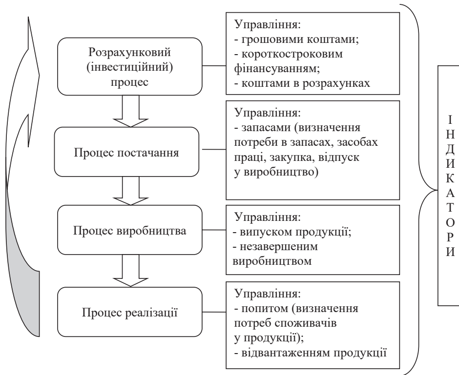
Рис. 3. Взаємозв'язок бізнес-процесів аграрного підприємства та етапів управління оборотними активами