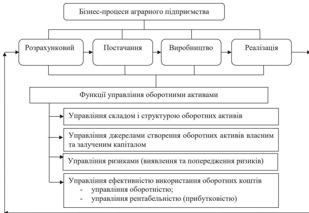
Рис. 4. Модель процесного підходу до управління оборотними активами

чуючи безперервність кругообігу оборотних коштів, за допомогою виконання певних функцій управління, які забезпечать управління як у рамках окремого бізнес