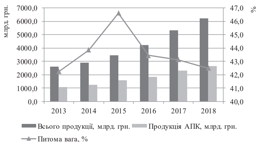
Рис. 2. Динаміка виробленої продукції підприємствами України за 2013–2018 рр.