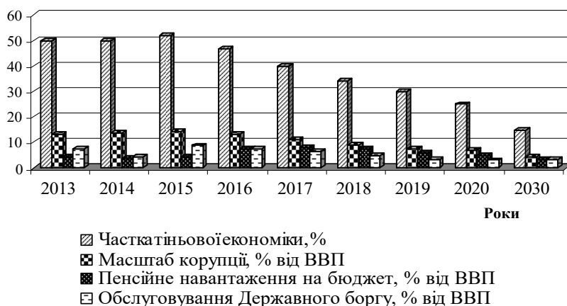
Рис. 2. Динаміка та прогнозування основних чинників, що гальмують розвиток економіки України, (прогноз на 2013–2030 рр.)

Як наслідок, є можливість створення на місцевому рівні фонду розвитку соціальної сільської інфраструктури, від запровадження якого буде отримано позитивні результати на всіх рівнях ієрархії. Так, на мегарівні отримується можливість меншого залучення кредит-