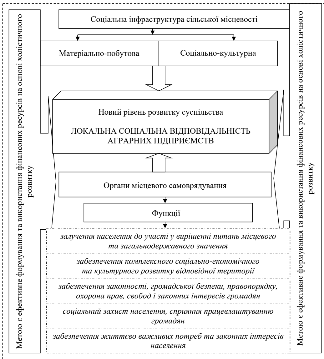
Рис. 3. Спільні риси прояву ЛСВ аграрних підприємств у розрізі соціальної інфраструктури на місцевому рівні