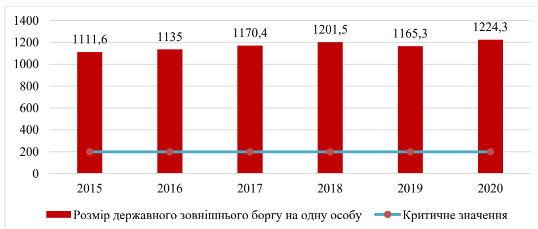
Рис. 2. Динаміка показника зовнішнього боргу в розрахунку на одну особу в 2015–2020 рр., дол.