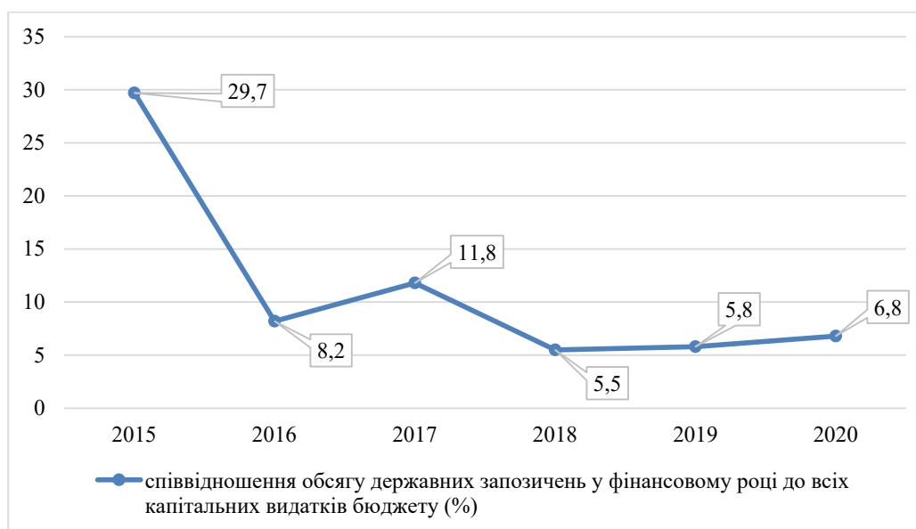
Рис. 1. Динаміка співвідношення обсягу державних запозичень у фінансовому році до всіх капітальних витрат бюджету за 2015–2020 рр.