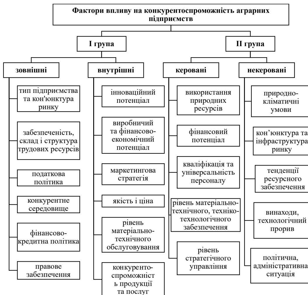
Рис. 1. Фактори, які впливають на конкурентоспроможність аграрних підприємств

Також Богомолова К. зазначає, що найважливішим фактором конкурентоспроможності аграрного підприємства є конкурентоспроможність його продукції. При цьому ключовою характеристикою продукції автор називає її цінову перевагу. Зниження витрат пропонується досягти за рахунок підвищення продуктивності праці, ефективного використання ресурсів та виробничого потенціалу, впровадження науково