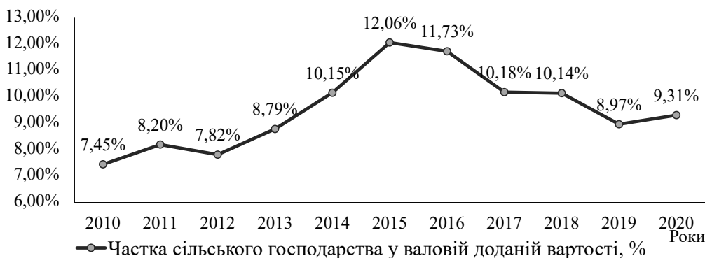
Рис. 3. Динаміка частки сільського господарства у ВВП України у 2010–2020 роках