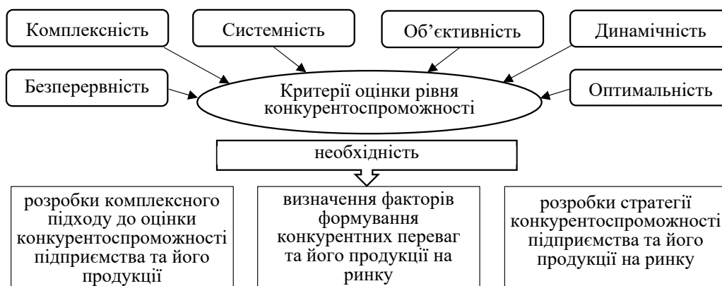
Рис. 2. Критерії оцінки рівня конкурентоспроможності аграрних підприємств

– нормативно-правова нестабільність в аграрному секторі;