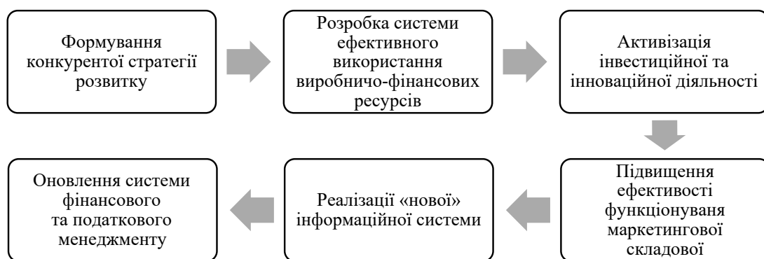
Рис. 5. Організаційно-економічний механізм управління конкурентоспроможністю підприємства