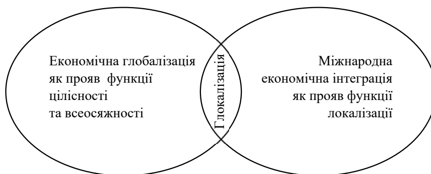
Рис. 1. Глокалізація як похідна перетину економічної глобалізації та міжнародної економічної інтеграції

В світлі представлених критеріїв виявлення спільного та відмінного між МЕІ та ЕГ, найбільш актуальним виглядає останній з них, а саме суб'єктний вимір, врахуванню впливу якого на відношення між зазначеними феноменами, приділяється підвищена увага зарубіжних науковців. Відстежуючи перехід від локального до глобального, як однієї з домінуючих тенденцій міжнародних відносин, С. Ульген і Д. Інан [22] акцентують увагу в цьому контексті на зростаючій ролі політики національних урядів та міжнародних організацій, спрямованої на подолання диспропорцій та різючої соціальної нерівності, оскільки «глобалізація призвела до перерозподілу доходів на користь капіталу за раху-