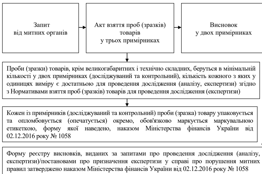
Рис. 2. Схема проведення митної експертизи