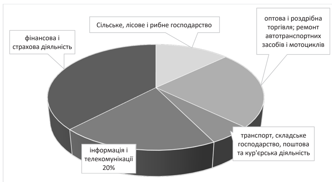
Рис. 3. Найбільші сфери економічної діяльності за надходженням інвестицій в Україну за 2022 рік