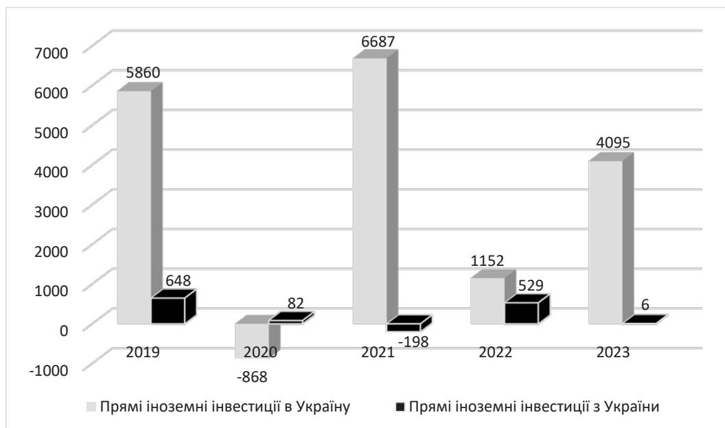
Рис. 2. Динаміка потоку прямих інвестицій за 2019–2023 рр. (млн дол. США)

Для стимулювання інвестиційних потоків Верховна Рада на засіданні 22 листопада 2023 р. прийняла в цілому проект Закону про внесення змін до Закону України «Про фінансові механізми стимулювання експортної діяльності» щодо страхування інвестицій в Україні від воєнних ризиків, який вступив в силу з