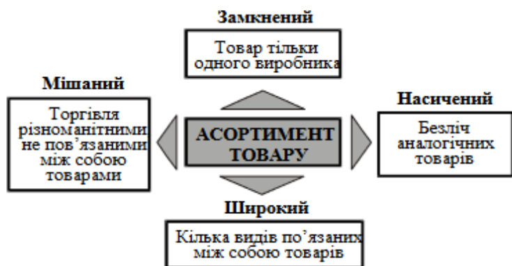
Рис. 1. Види асортименту