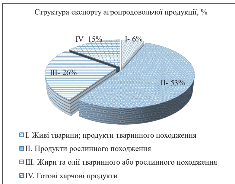
Рис. 1. Частка експорту агропродовольчої продукції у структурі загального експорту, 2023 р., %

У загальному обсязі світового експорту агропродовольчої продукції, згідно з даними Світової організації торгівлі (СОТ), у 2022 р. Україні належав 1%, в той час як, наприклад, Польщі – 2,26%, Німеччині – 4,6%, США – 9,6% [13]. Безумовно, торгівля агропродовольчою продукцією, враховуючи природно-географічний, ресурсний та людський потенціал нашої країни, здатна