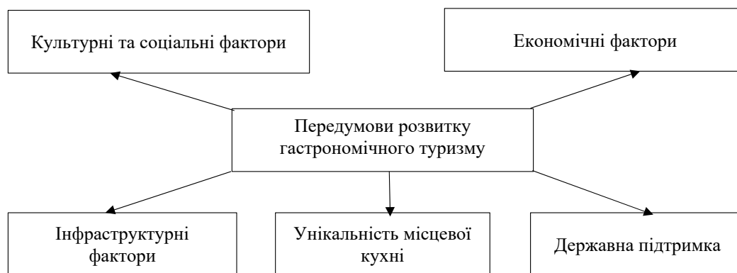
Рис. 1. Класифікація факторів як передумов розвитку гастрономічного туризму