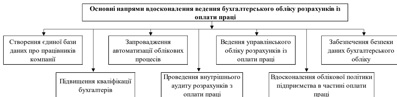
Рис. 1. Основні напрями вдосконалення ведення бухгалтерського обліку розрахунків із оплати праці