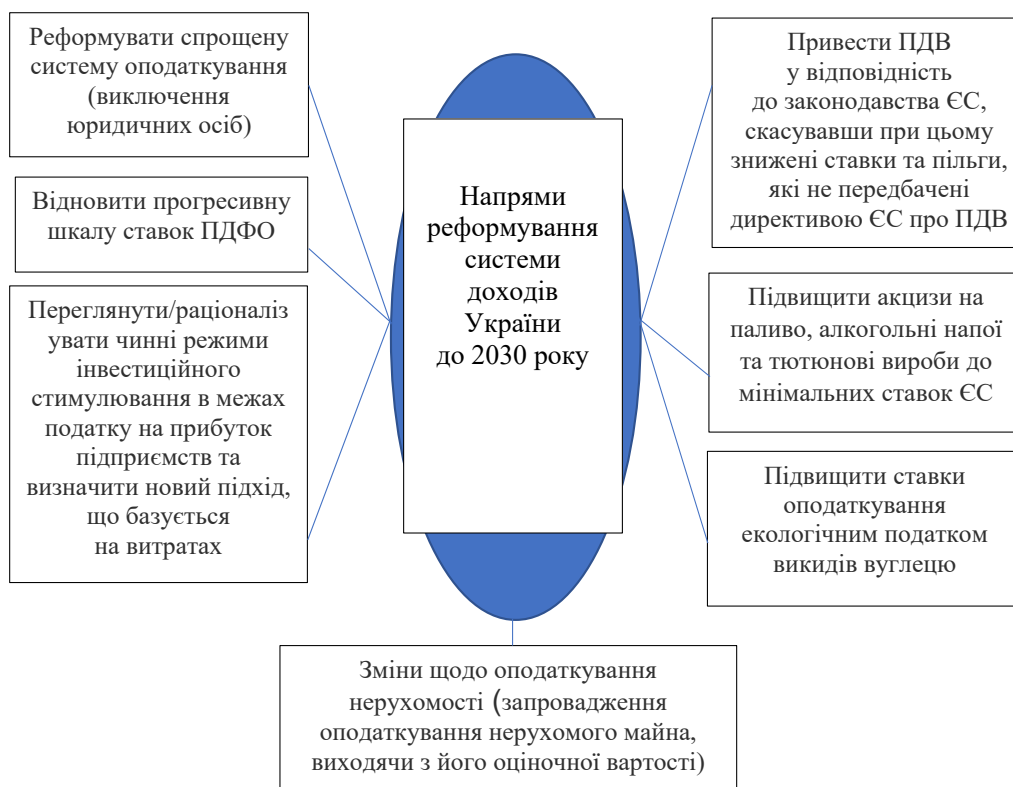
Рис. 3. Напрями Національної стратегії доходів України до 2030 року