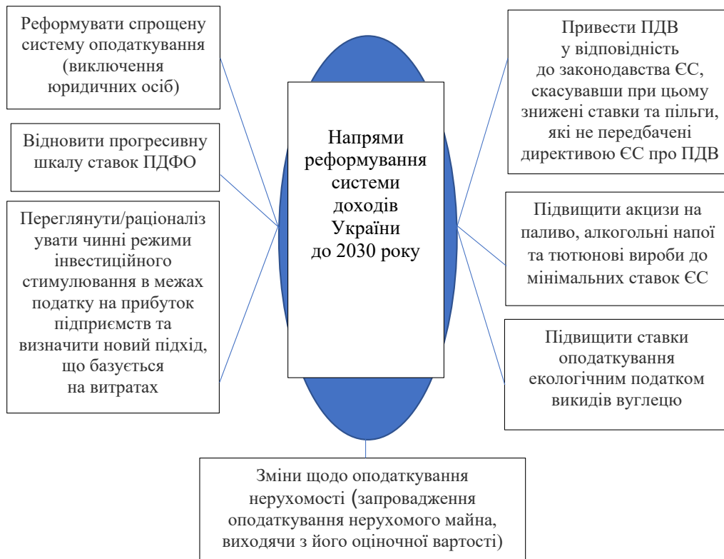
Рис. 3. Напрями Національної стратегії доходів України до 2030 року