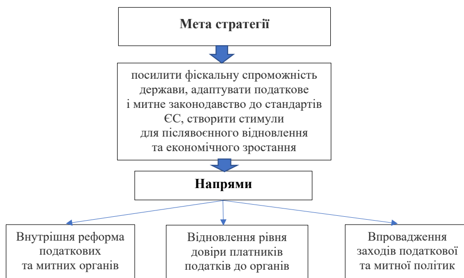
Рис. 2. Стратегічні напрями реформування податкової і митної систем

В теперішній час дуже важливим є і забезпечення безпеки та розумного управління перевірки, що має велику важливість для платників податків. Податкові перевірки можуть стати джерелом стресу та незручностей для бізнесу, особливо в умовах нестабільності, такої як воєнний стан. Недостатня безпека під час перевірок може призвести до порушень прав платників