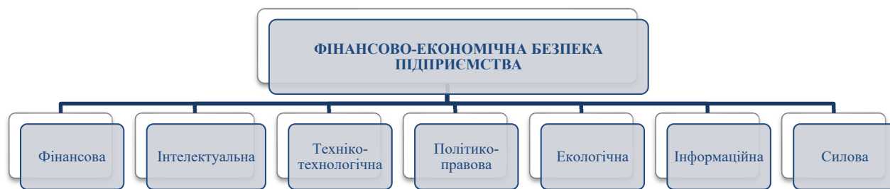
Рис. 2. Функціональні складові фінансово-економічної безпеки підприємства

питань, щоб визначити природу фінансово-економічної безпеки, а також підходи до розробки методів її забезпечення у контексті етичних аспектів ведення бізнесу.