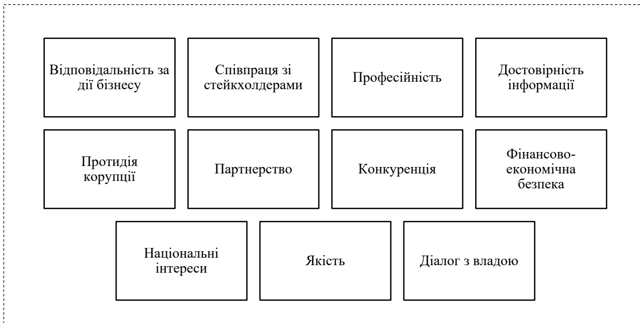
Рис. 3. Перелік основоположних етичних принципів ведення бізнесу та забезпечення його фінансово-економічної безпеки

Джерело: розроблено автором на підставі [7; 10]